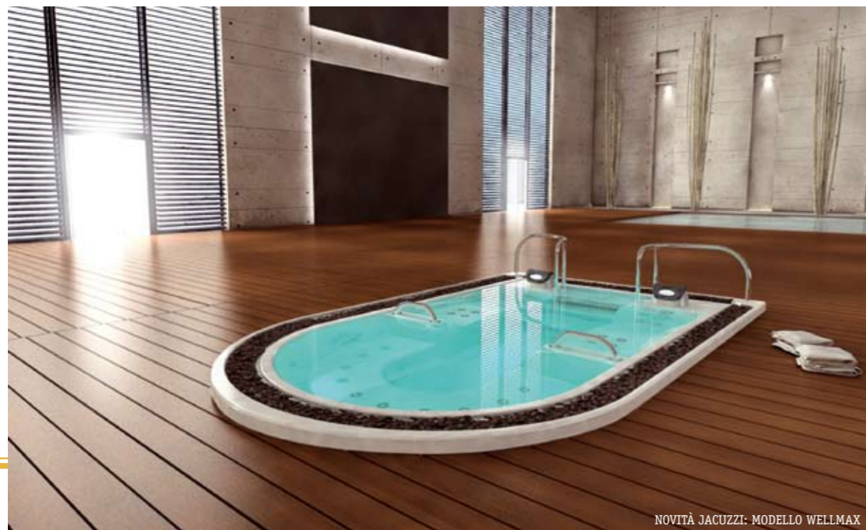
NOVITÀ JACUZZI: MODELLO WELLMAX

La spa sta per “ salus per aquam ” degli antichi Romani, ossia il benessere attraverso l’acqua. Il concetto si è poi ampliato con la creazione di ambienti con differenti rapporti temperatura-umidità, quali laconicum, caldarium, sudatorium, e frigidarium, volendo utilizzare i nomi latini della sauna, della biosauna, del bagno turco (detto “hammam” in arabo) e del bagno gelato, fino alla piscina idromassaggio. Dall’invenzione dell’idromassaggio da parte di Jacuzzi più di 50 anni fa per alleviare le sofferenze provocate ad