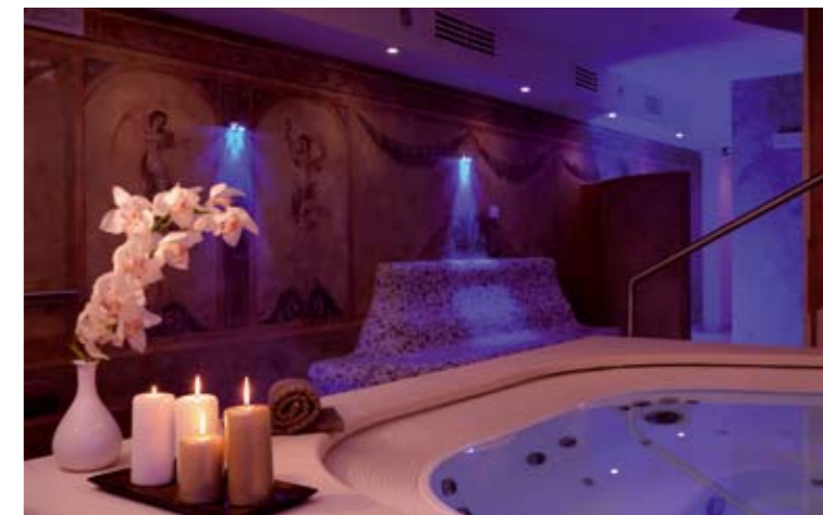
CENTRO BENESSERE HOTEL MASTINO DI VERONA