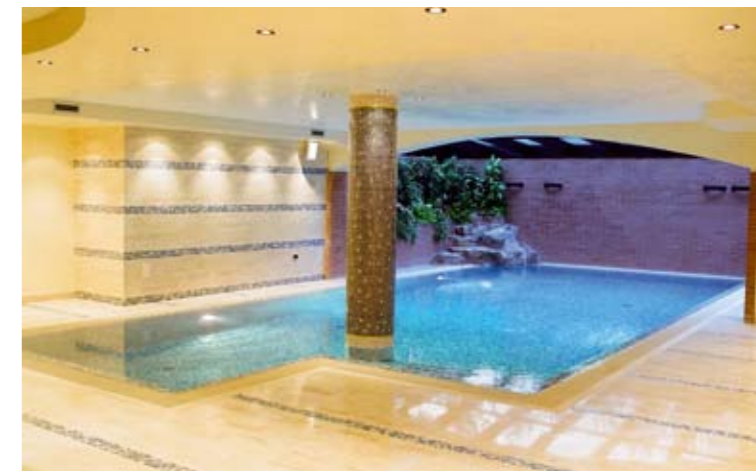
PISCINA A SFIORO CON RIVESTIMENTO IN MOSAICO